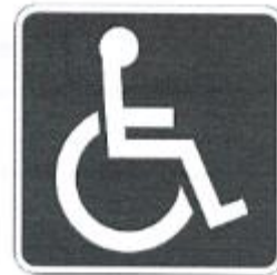
Nuevo Símbolo de Accesibilidad Universal