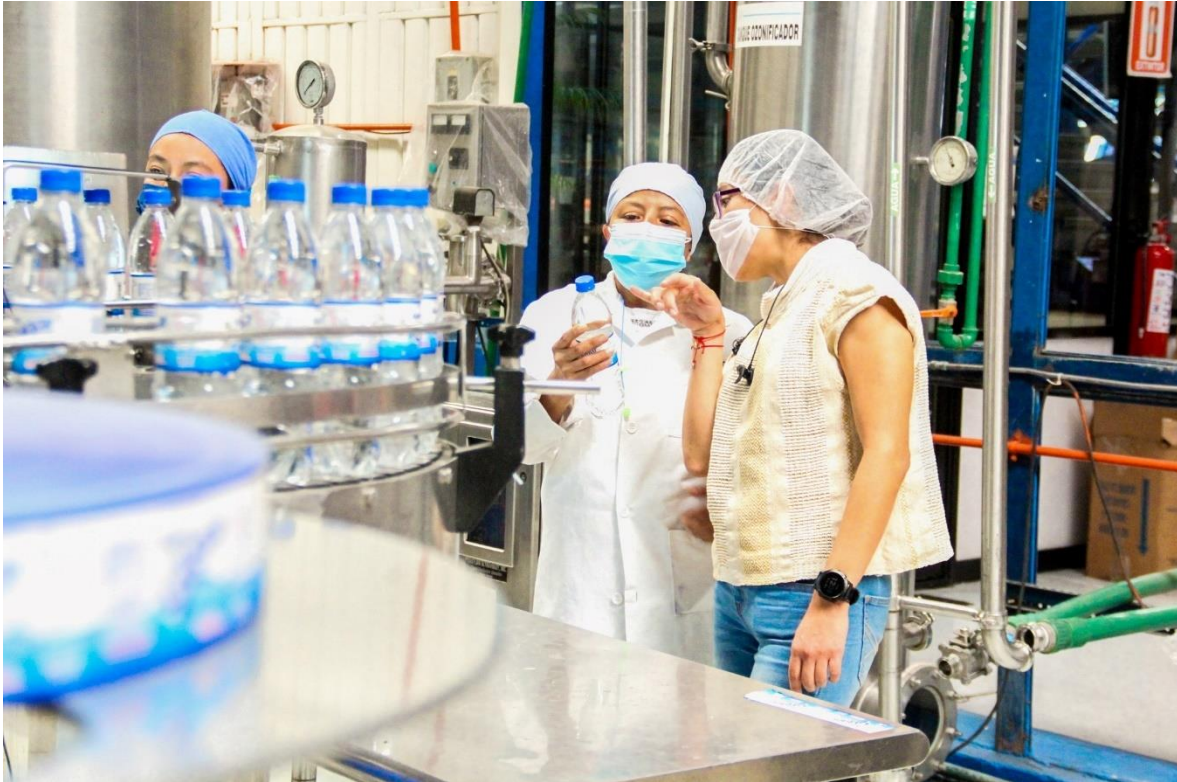
Fotografía: Recorrido de explicación sobre procesos de producción y el uso de materiales reciclables.

El trabajo en campo es importante por lo que el visitar a las empresas en sus instalaciones es una labor relevante para el acercamiento, la sensibilización de las necesidades de los empresarios y la atención de peticiones, ejemplo de ello fue la visita realizada a Envasadora Gugar, en la cual conocí sus instalaciones, infraestructura, procesos y proyectos sustentables aplicados a su producción.