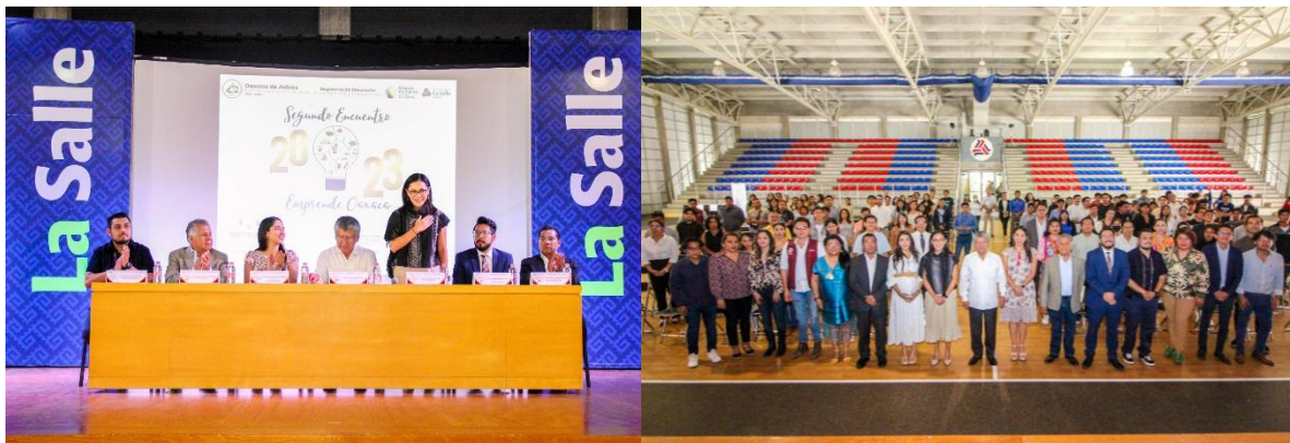
Fotografías: El Segundo Encuentro Emprende Oaxaca 2023 se realizó en la Universidad La Salle Oaxaca

La segunda versión del Encuentro Emprende Oaxaca realizado como parte del programa de trabajo de la regiduría que presido se llevó a cabo los pasados 5 y 6 de septiembre y tuvo como aliado principal a la Universidad La Salle Oaxaca quien otorgó las facilidades para ocupar sus instalaciones y la participación entusiasta de sus alumnos en los diversos segmentos del evento.