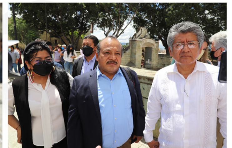
REGIDURÍA DE PROTECCIÓN CIVIL Y DE ZONA METROPOLITANA