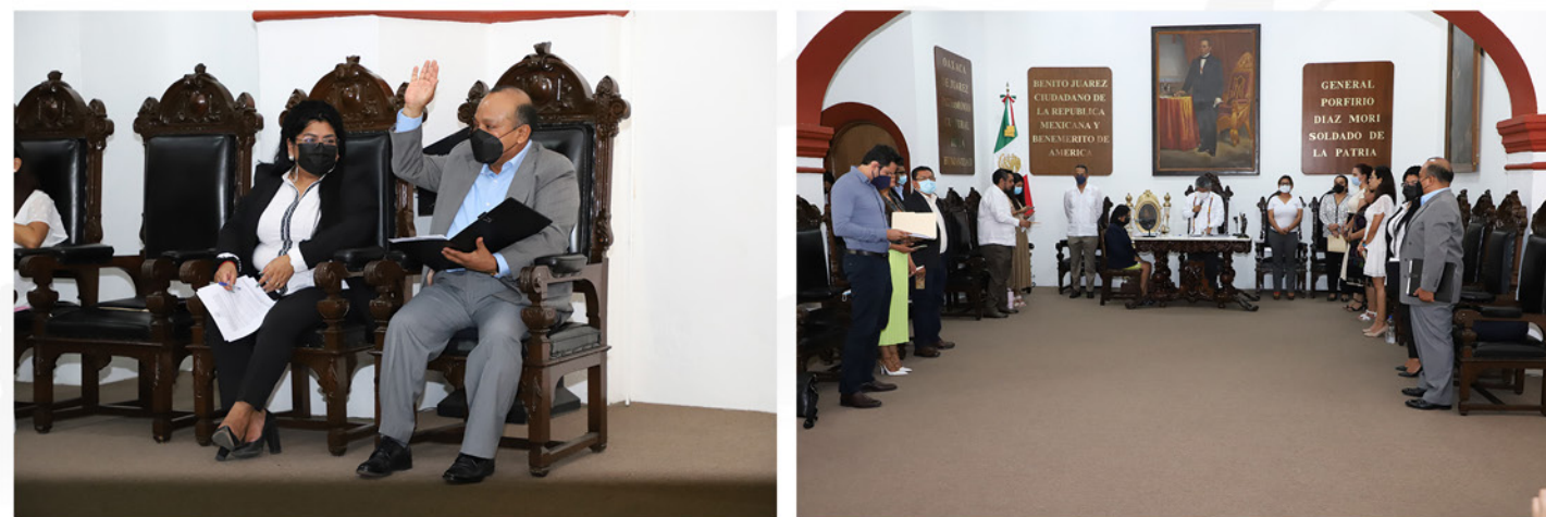
REGIDURÍA DE PROTECCIÓN CIVIL Y DE ZONA METROPOLITANA