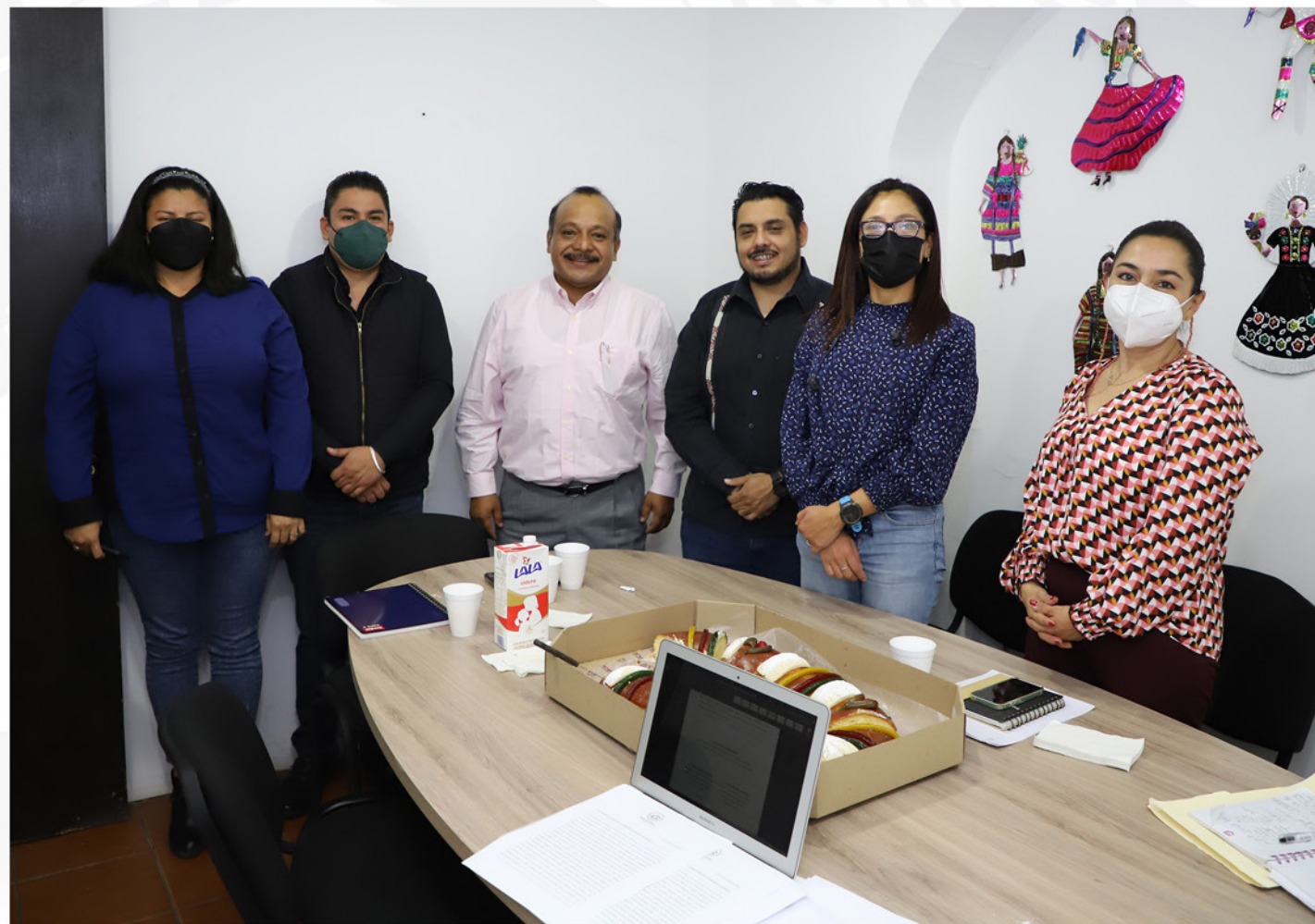
REGIDURÍA DE PROTECCIÓN CIVIL Y DE ZONA METROPOLITANA

Cabe destacar que se aprobó el reconocimiento oficial y regularización del asentamiento humano denominado “José López Alavez”, perteneciente a la Agencia Municipal de Santa Rosa Panzacola; así mismo, se aprobó el Programa Anual de Obras del Ejercicio Fiscal 2022.