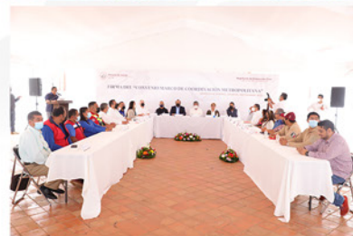
REGIDURÍA DE PROTECCIÓN CIVIL Y DE ZONA METROPOLITANA

• Demostrando orden y responsabilidad, este segundo día del mes participamos en el simulacro de sismo convocado por la Dirección Municipal de Protección Civil, logrando la evacuación de las instalaciones en un tiempo de tres minutos y diez segundos.