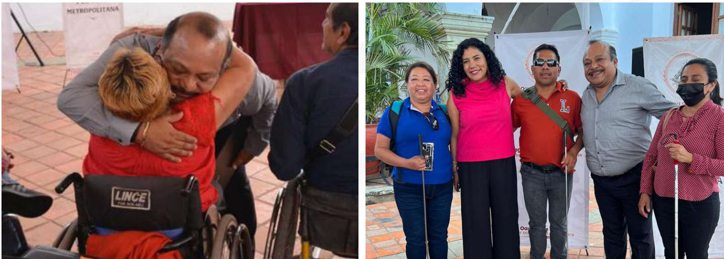
REGIDURÍA DE PROTECCIÓN CIVIL Y DE ZONA METROPOLITANA

• El día tres de diciembre, Día Internacional de las Personas con Discapacidad hice hincapié para seguir promoviendo la inclusión y la no discriminación de este sector.