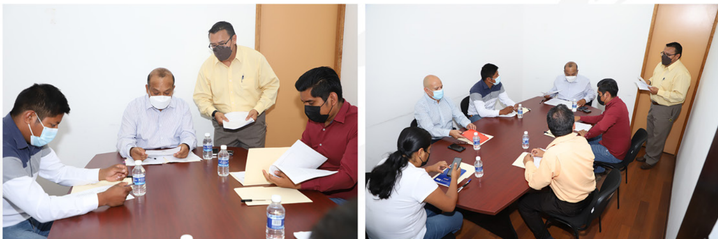
REGIDURÍA DE PROTECCIÓN CIVIL Y DE ZONA METROPOLITANA