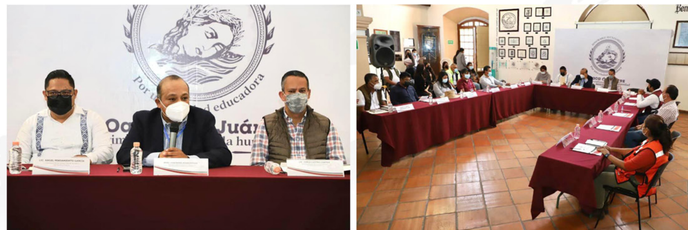
REGIDURÍA DE PROTECCIÓN CIVIL Y DE ZONA METROPOLITANA