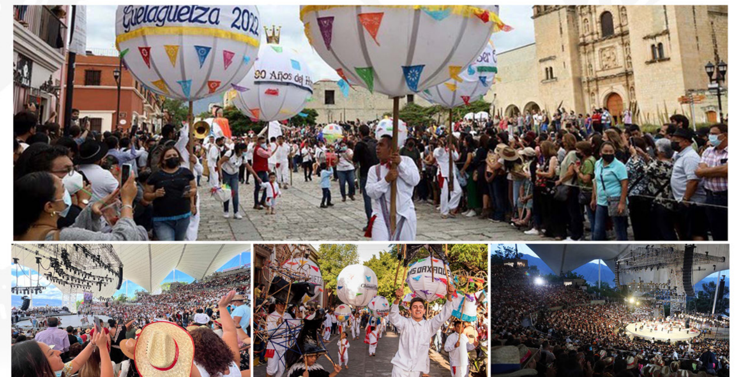
REGIDURÍA DE PROTECCIÓN CIVIL Y DE ZONA METROPOLITANA

Dado el impacto negativo e inevitable que ocasionó citada situación de emergencia; como Comisión nos propusimos impulsar las actividades culturales, artísticas y deportivas, así como eventos masivos como conciertos en el Auditorio Guelaguetza, calendas, festividades conmemorativas y religiosas, los cuáles ayudaron a poner en alto la imagen de la ciudad, respetando las debidas medidas sanitarias de acuerdo al Semáforo de Riesgo Epidemiológico, el reglamento y principalmente la anuencia vecinal de las distintas colonias del Municipio.