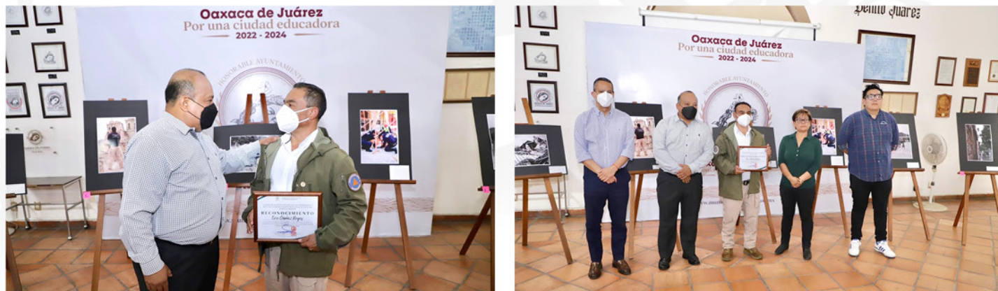
REGIDURÍA DE PROTECCIÓN CIVIL Y DE ZONA METROPOLITANA