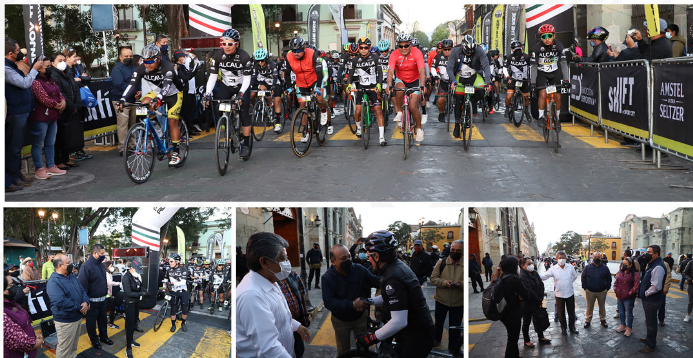
REGIDURÍA DE PROTECCIÓN CIVIL Y DE ZONA METROPOLITANA