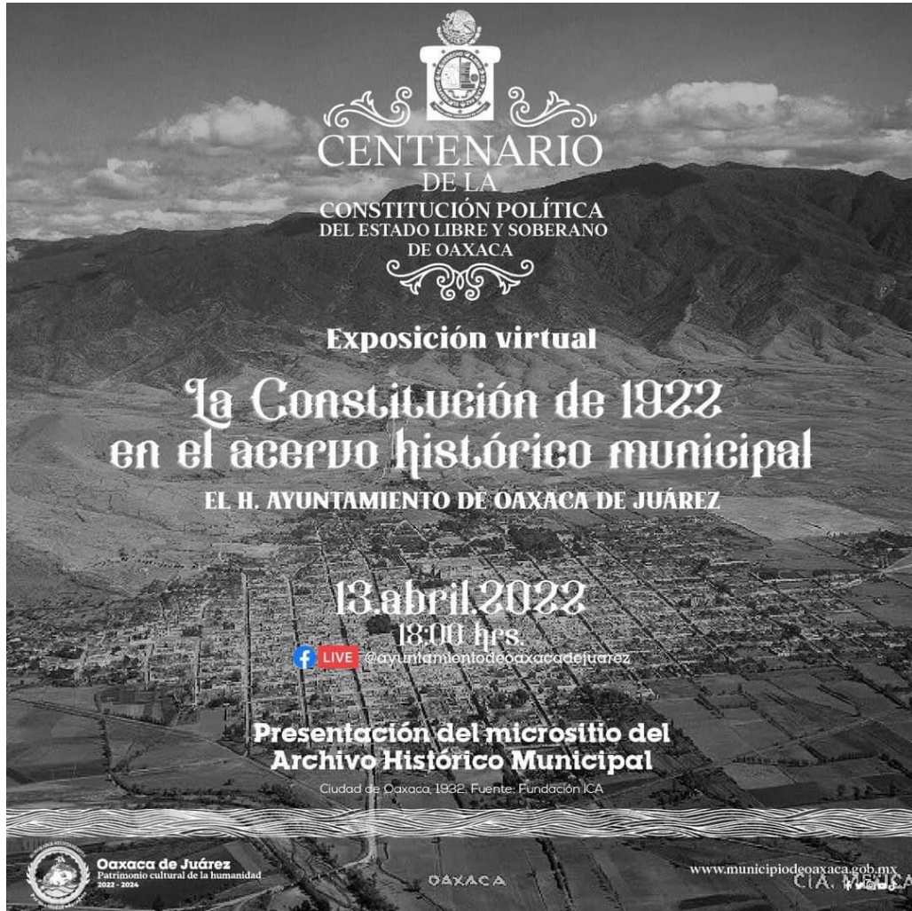
Exposición “La Constitución de 1932 en el acervo histórico municipal”, en coordinación con el Archivo Histórico de la Ciudad de Oaxaca