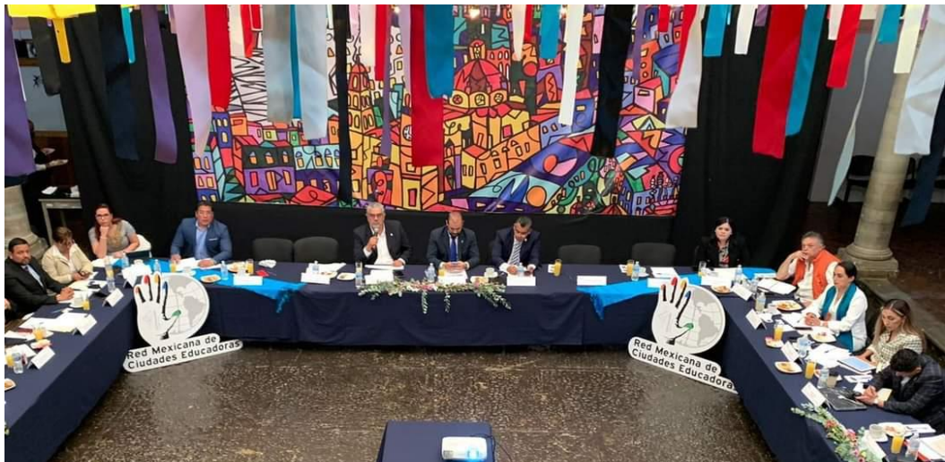
Representación de Oaxaca de Juárez en la Asamblea Nacional de Ciudades Educadoras