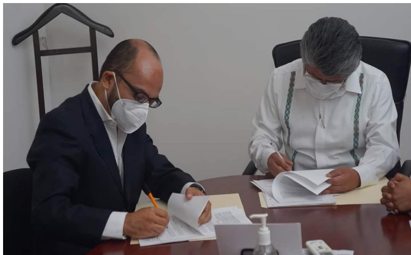
Firma de Convenio de Colaboración con la Casa de la Cultura Oaxaqueña