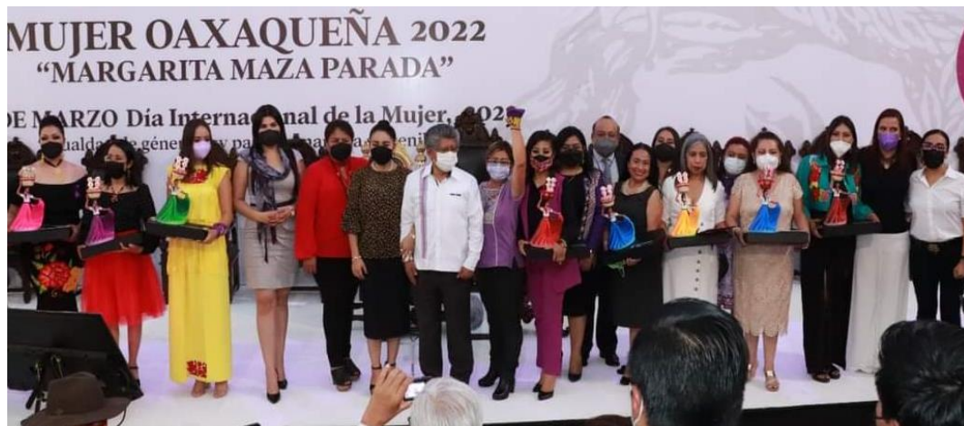
Entrega de la Distinción Ciudadana Mujer Oaxaqueña 2022 “Margarita Díaz Parada”