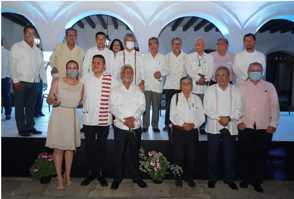
Día Municipal de la Crónica Histórica