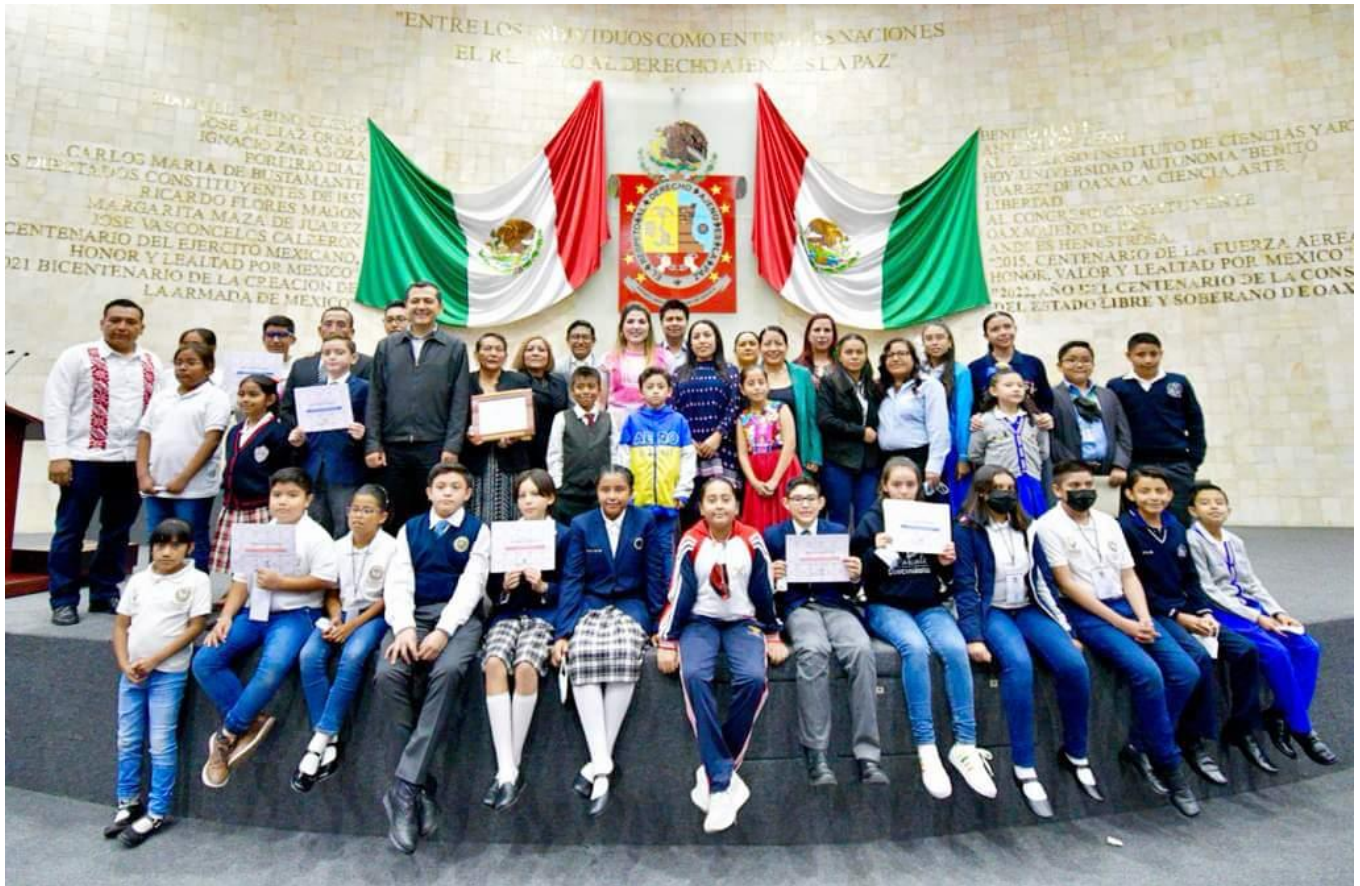
Presentación de los cabildos infantil y juvenil en el H. Congreso del Estado