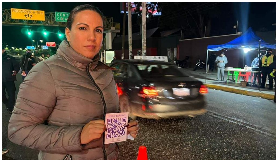
Sociabilización del #CódigoVioleta en escuelas y puntos de control de alcoholimetría