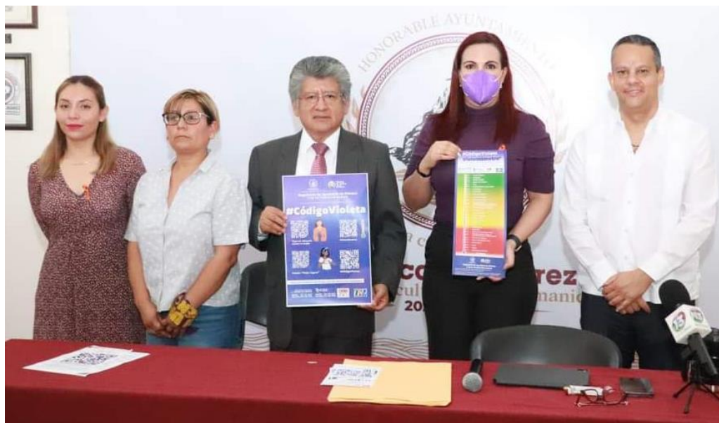
Presentación del programa de acceso a la información en favor de la eliminación de la violencia en contra de las mujeres, #CódigoVioleta