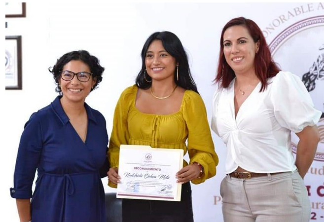
Commemoración del Día Internacional de las Ciudades Educadoras