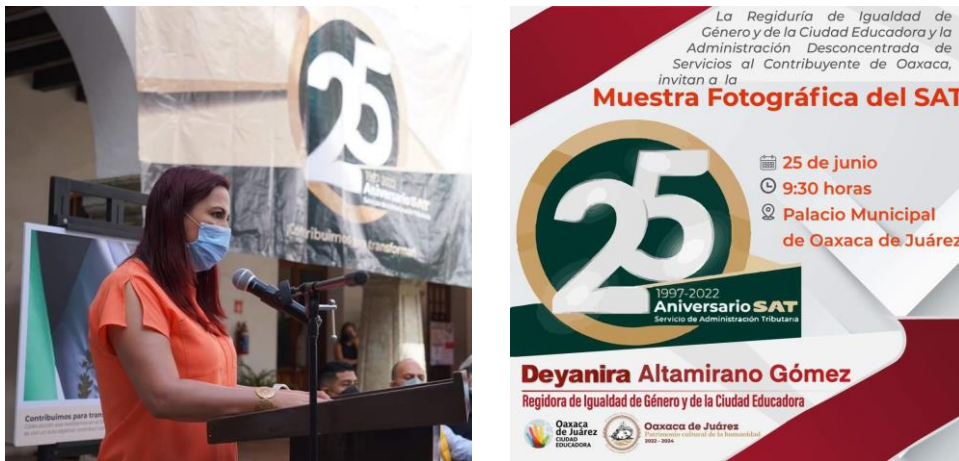
Exposición fotográfica en conmemoración del 25 aniversario del Sistema de Administración Tributaria