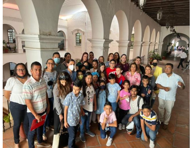
Instalación de Cabildo infantil