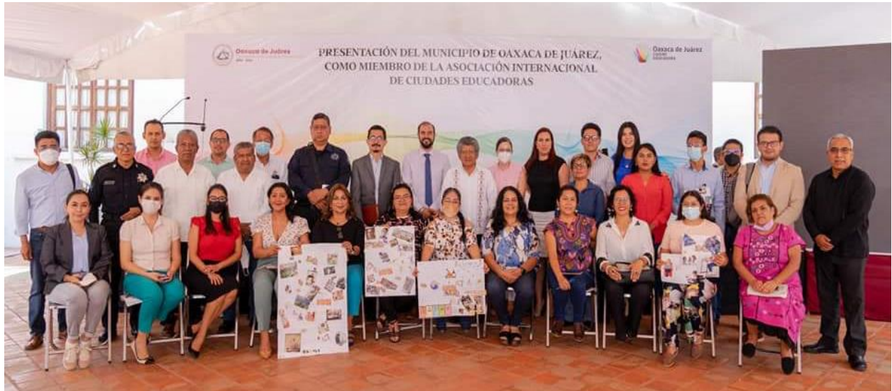
Presentación del Municipio de Oaxaca de Juárez como integrante de la Asociación Internacional de Ciudades Educadoras