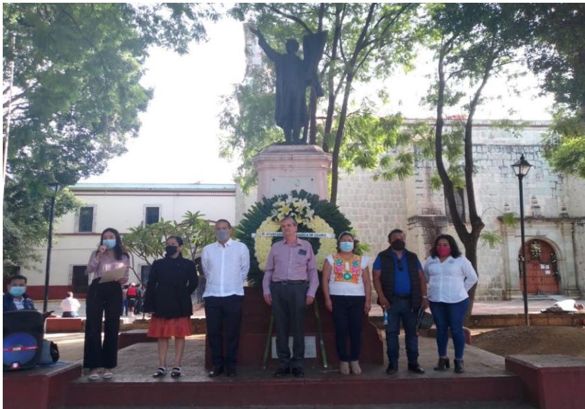
Guardia de Honor y Ofrenda Floral al "Padre de la Patria" Don Miguel Hidalgo y Costilla.