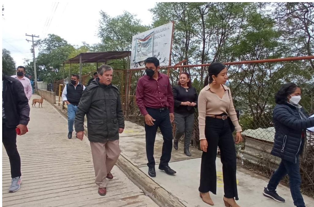
Recorrido por la Escuela Primaria Independencia, ubicada en la parte alta de la Agencia Municipal de Santa Rosa Panzacola.