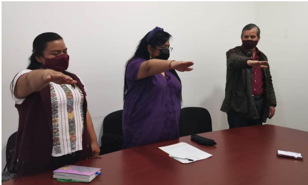
En la Instalación de la Comisión de Asuntos Indígenas y Afromexicanos

Desde la Comisión de Asuntos Indígenas y Afromexicanos trabajamos para el respeto, promoción, preservación, visibilización, protección y garantías de paz social y seguridad de nuestras lenguas y comunidades Indígenas.