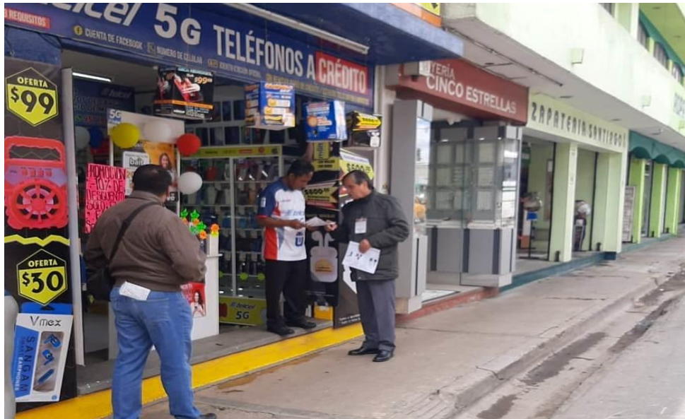
Concientizando a la Ciudadanía sobre la separación de los residuos sólidos urbanos, en diversas calles del Centro Histórico del Municipio de Oaxaca de Juárez.

Ante la problemática que enfrenta nuestro Municipio con el tema de Residuos Sólidos Urbanos, nos dimos a la tarea de unirnos a las brigadas donde llevamos información a la ciudadanía del correcto manejo de estos, y su debida clasificación.