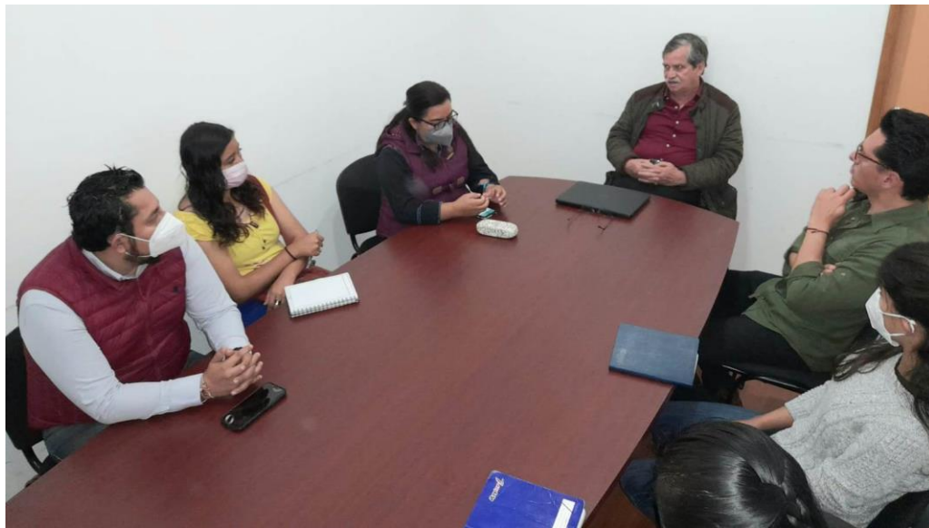
En sesión extraordinaria de la Comisión de Bienestar, con la participación del Secretario de Bienestar y el Director de Bienestar Municipal.