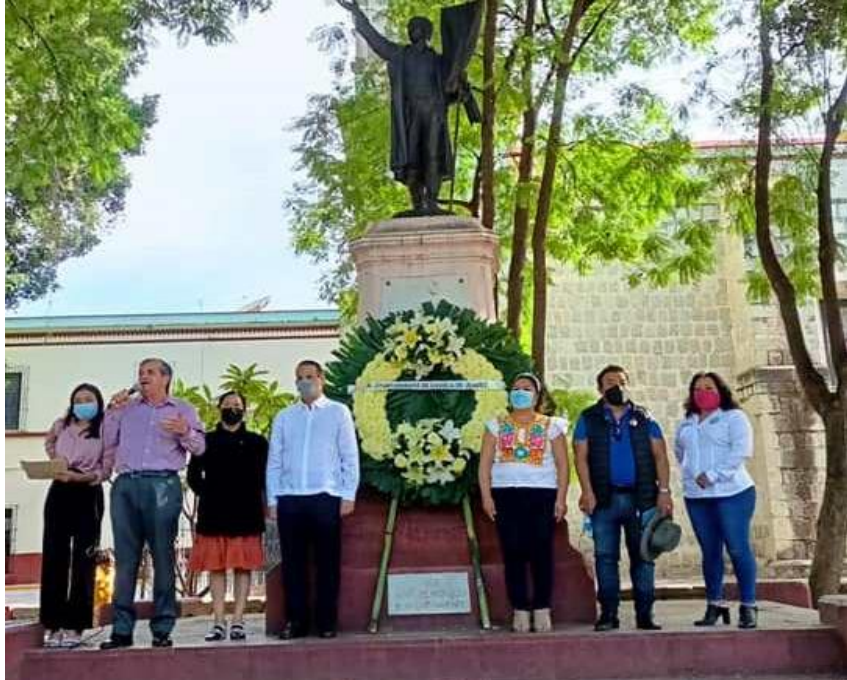
En uso de la palabra en el 211 Aniversario Luctuoso de Don Miguel Hidalgo Y Costilla.