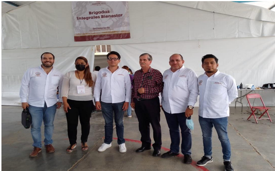
Brigada Bienestar en la Agencia de Pueblo Nuevo.

Una de las obligaciones como Concejal es vigilar cada una de las acciones de este H. Ayuntamiento que mediante sus diferentes dependencias realiza, por ello participe y atestigüe los Servicios y actividades que la Secretaría de Bienestar Municipal acerca a las y los ciudadanos mediante las llamadas Brigadas Integrales Bienestar y Jornadas Educativas Bienestar, asistiendo a un total de 11.