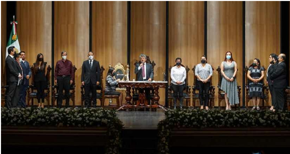
El 24 de Agosto en la Sesión Solemne de Cabildo con motivo del 153 Aniversario Luctuoso de Macedonio Alcalá.