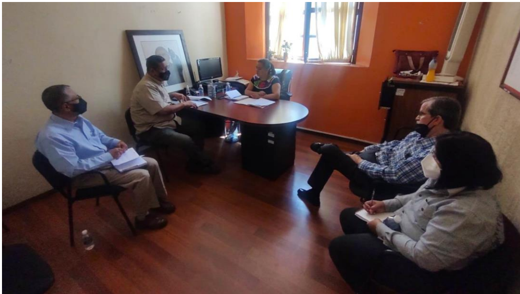
En comisión ordinaria de la Comisión de seguridad pública.

En la Comisión de Seguridad Pública hemos analizado, propuesto y resuelto programas de Seguridad Pública y en materia de Movilidad en beneficio de la Ciudadanía, así como programas para prevenir los diversos delitos que tanto han crecido en nuestro Municipio.