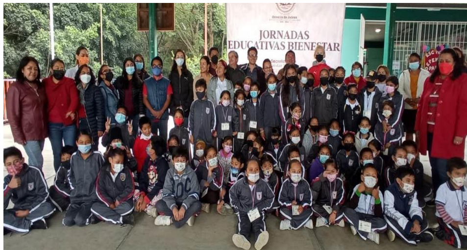
Jornada Educativa Bienestar en la Primaria Independencia