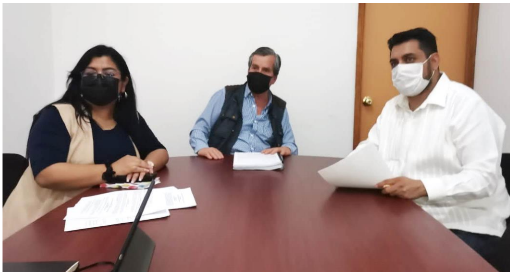
En la Instalación de la Comisión de Normatividad y Nomenclatura Municipal.

Como presidente de la Comisión de Normatividad he convocado a 14 Sesiones ordinarias de la misma y 6 Sesiones Ordinarias en Comisiones Unidas donde hemos estudiado, mejorado y aprobado diversas iniciativas de compañeras y compañeros concejales en diferentes temas para la normatividad de la Administración Municipal.