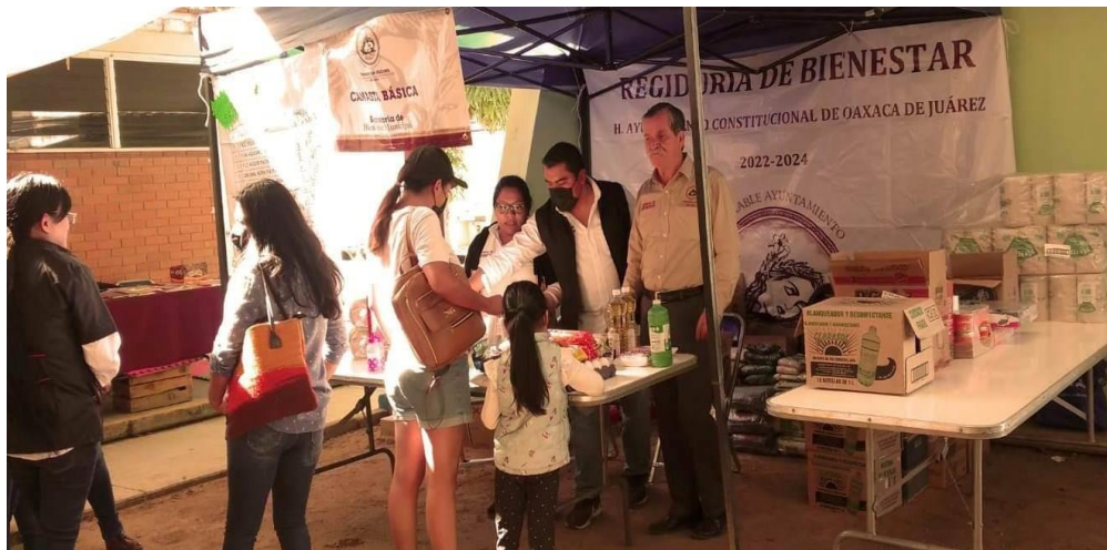
Venta de productos de la canasta básica, en el fraccionamiento Elsa, de la Agencia de Santa Rosa Panzacola.

Como iniciativa propia y en apoyo a la economía de las y los ciudadanos de este municipio, en el mes de septiembre iniciamos la oferta de productos de la canasta básica, con un subsidio otorgado por esta regiduría, a la fecha hemos participado en 6 Brigadas Integrales Bienestar donde ofertamos dichos productos de canasta básica.