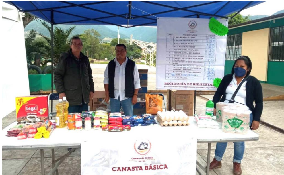
Venta de productos de la canasta básica a bajo costo en la Agencia de Trinidad de Viguera.