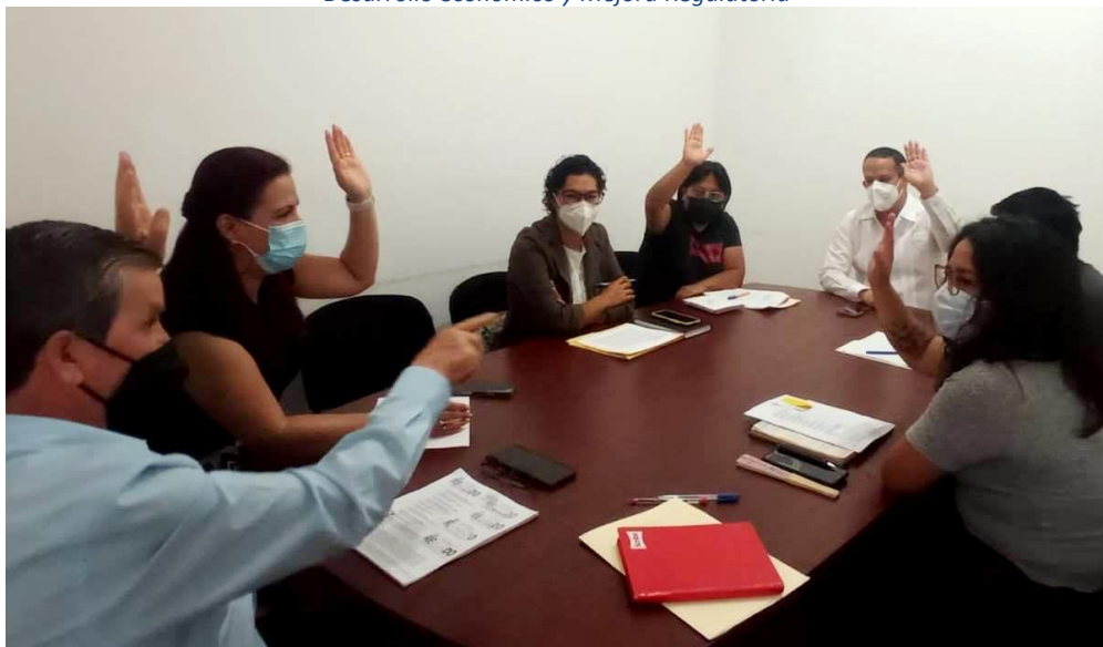
Sesión Extraordinaria de Comisiones Unidas de Normatividad y Nomenclatura Municipal; de Igualdad de Género; y de Hacienda Municipal, en donde se aprobó la reforma al artículo 124 del Bando de Policía y Gobierno del Municipio de Oaxaca de Juárez