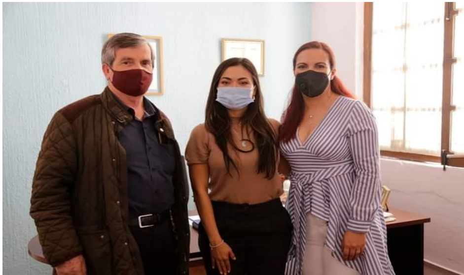
En la Instalación de la Comisión de Atención a Grupos en Situación de Vulnerabilidad.

Junto a las Compañeras Concejales que integran la Comisión de Atención de Grupos en situación de Vulnerabilidad trabajamos para garantizar la seguridad y vida digna e integral de las personas que se encuentran en esta condición.