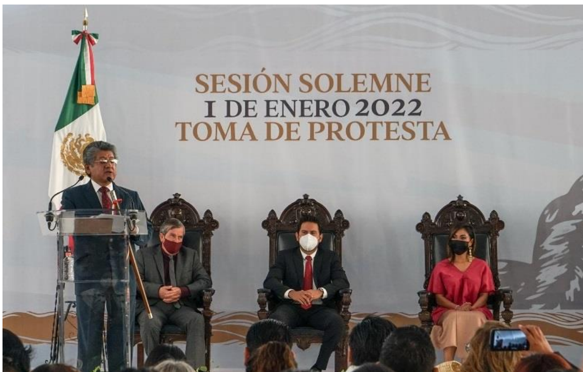
Presente en la sesión solemne en donde tomé protesta como Regidor de Bienestar y de Normatividad y Nomenclatura Municipal, el día 01 de enero.

En el transcurso del año, he asistido a 3 Sesiones Solemnes, siendo estas el 1 de enero Toma de Protesta a Integrantes del nuevo Cabildo, la segunda de ellas el 25 de abril con motivo del 490 Aniversario de la elevación de Villa al rango de Ciudad a la nueva Antequera hoy Oaxaca de Juárez y el 24 de agosto para conmemorar el 153 Aniversario Luctuoso del Compositor Oaxaqueño Macedonio Alcalá.