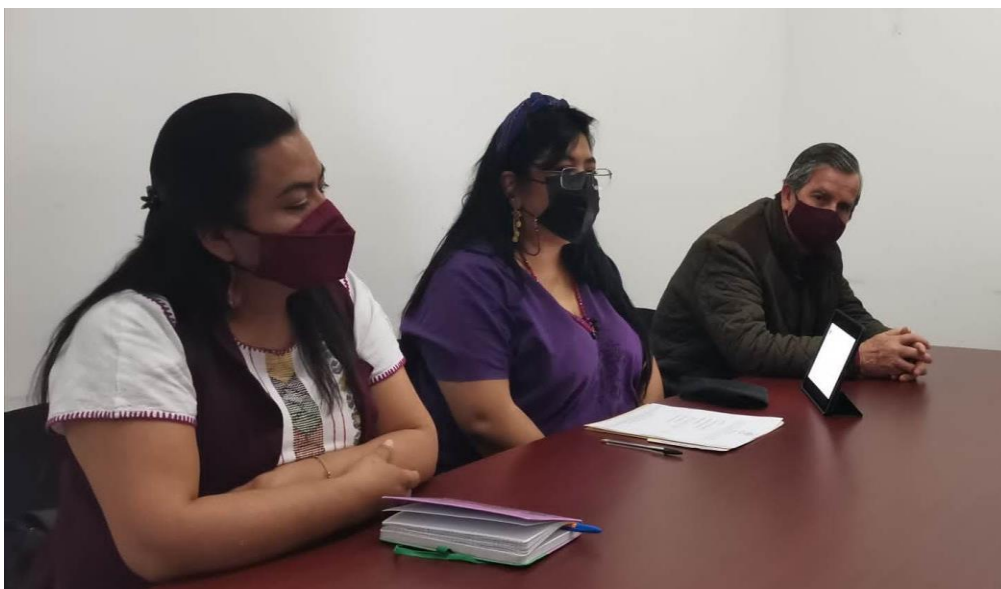
En la Instalación de la Comisión de Asuntos Indígenas y Afromexicanos