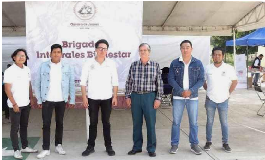
Jornada Integral Bienestar en la Agencia de Trinidad de Viguera