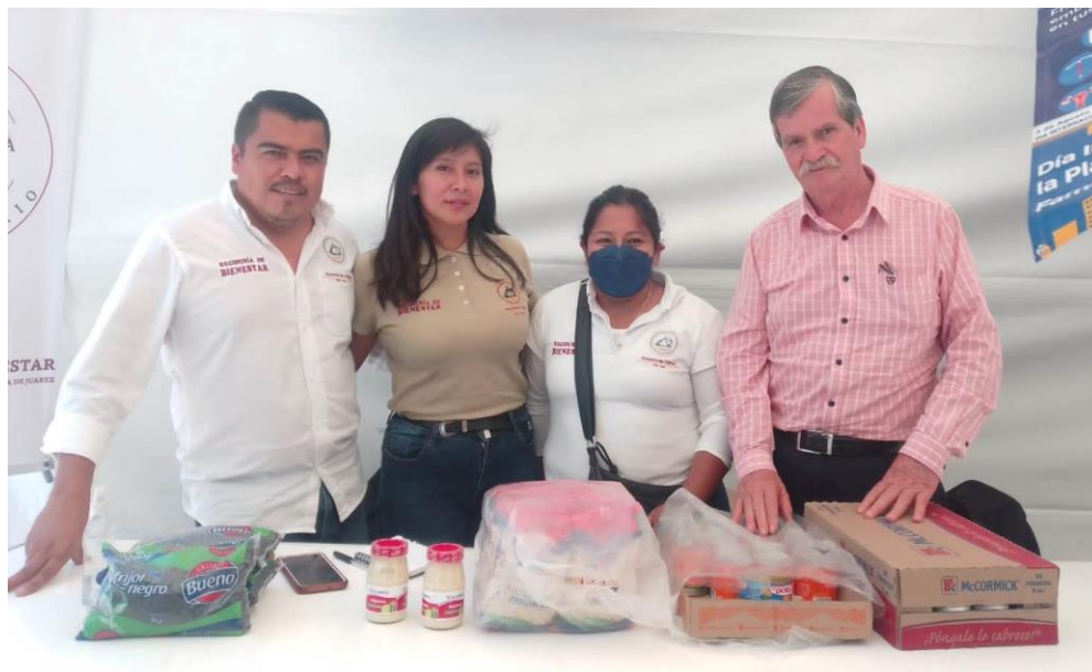
Venta de productos de canasta básica a bajo costo en la Agencia de San Juan Chapultepec.