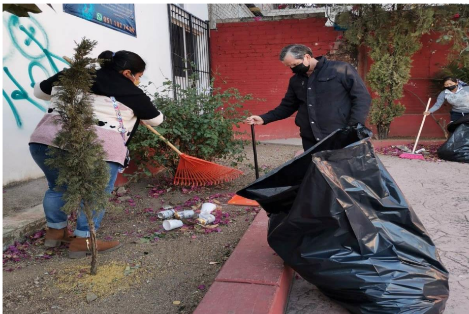
Realización de Tequio en el Jardín Bicentenario de la Agencia de Montoya, el día 26 de marzo