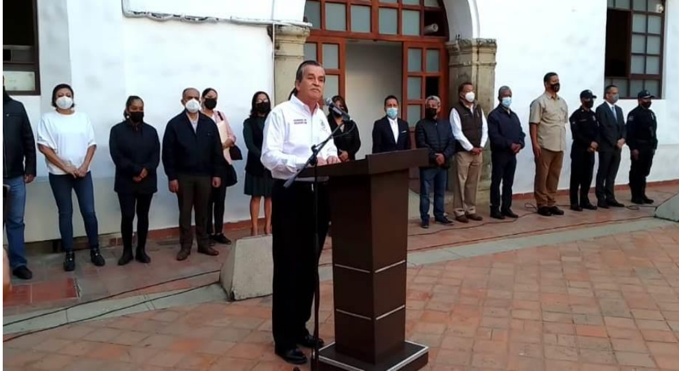
Mensaje en el 84 Aniversario de la Expropiación Petrolera.