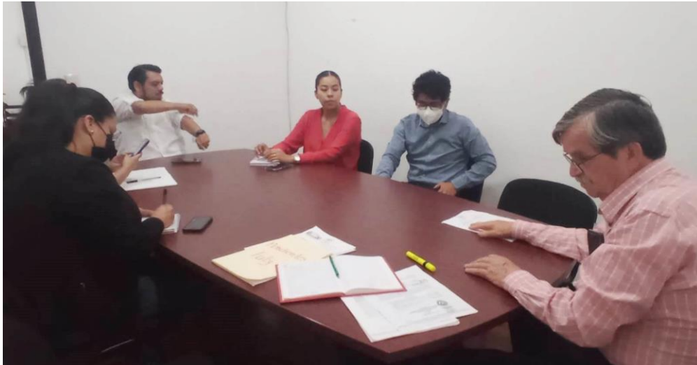
Sesión extraordinaria de las Comisiones Unidas de Normatividad y Nomenclatura Municipal y de Desarrollo económico y Mejora Regulatoria

Como apoyo y para pronta resolución de diversos temas y siendo esta una facultad que se tiene convoque a 28 sesiones Extraordinarias de la Comisión de Normatividad y 22 Sesiones en Comisiones Unidas para estudiar y dictaminar distintos puntos de acuerdo presentados por compañeras y compañeros concejales.