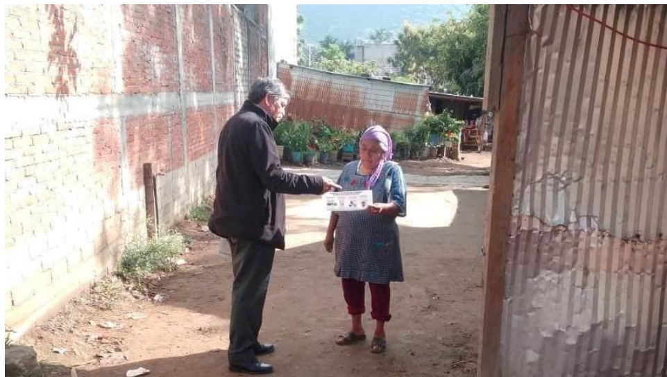
Concientizando a la Ciudadanía sobre la separación de los residuos sólidos urbanos, en domicilios particulares de la Colonia Estado de Oaxaca, perteneciente a la Agencia Municipal de San Martín Mexicapam.