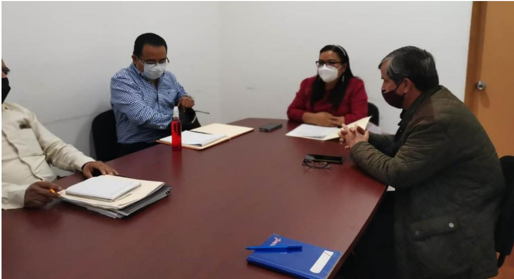
En sesión ordinaria de la Comisión de Agencias y Colonias.

En la Comisión de Agencias y Colonias a principio de año integramos las bases de participación para la elección de las Autoridades Auxiliares en cada una de las Agencias Municipales y de Policía con las que cuenta nuestro Municipio, además de estar atentos de las necesidades de cada uno de los sectores de nuestra población, escuchar y proponer soluciones a diversas necesidades planteadas. Siendo estas un total de 12 Sesiones asistidas.