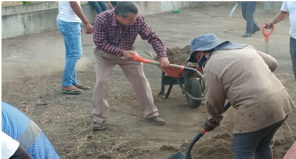
Tequio en el Parque del Monumento a la Madre.