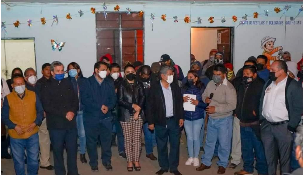
Visita a las Instalaciones del Centro de Transferencia el Arenal.