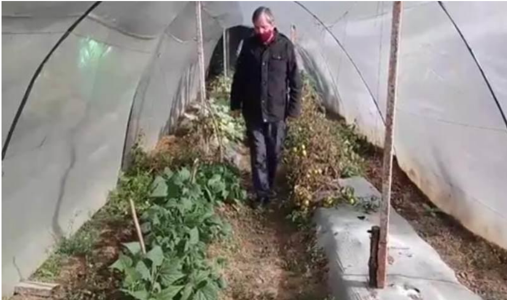
Supervisión del Proyecto Macro túneles, a cargo de la Secretaría de Bienestar Municipal, en la Agencia de San Felipe del Agua.