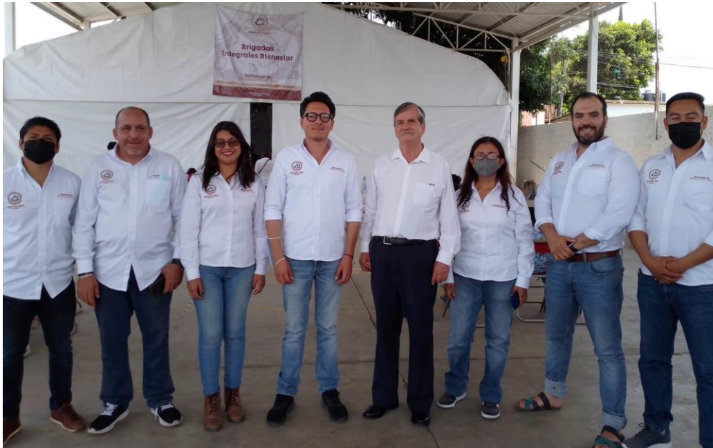
Jornada Integral Bienestar en la Agencia de Donají.