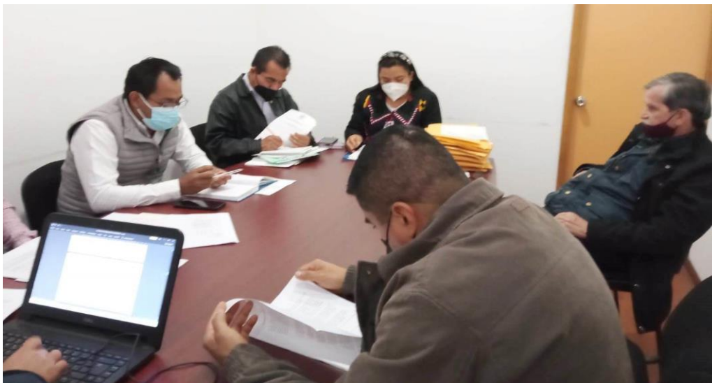
En sesión extraordinaria de la Comisión de Agencias y Colonias.