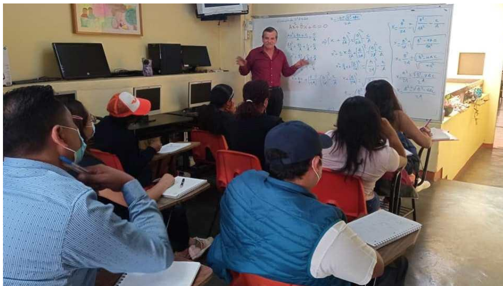
Impartiendo clases de Algebra en la Preparatoria Abierta "José Vasconcelos" el día 22 de julio