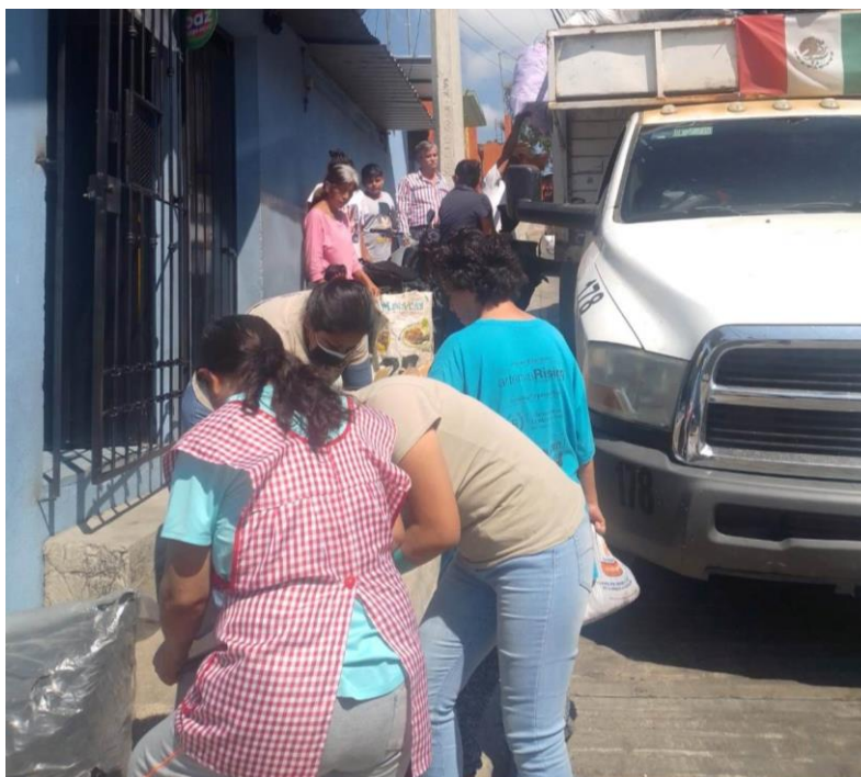
Explicando y Organizando a Vecinas y vecinos para la correcta separación y entrega de los Residuos Sólidos urbanos en las Unidades Recolectoras.