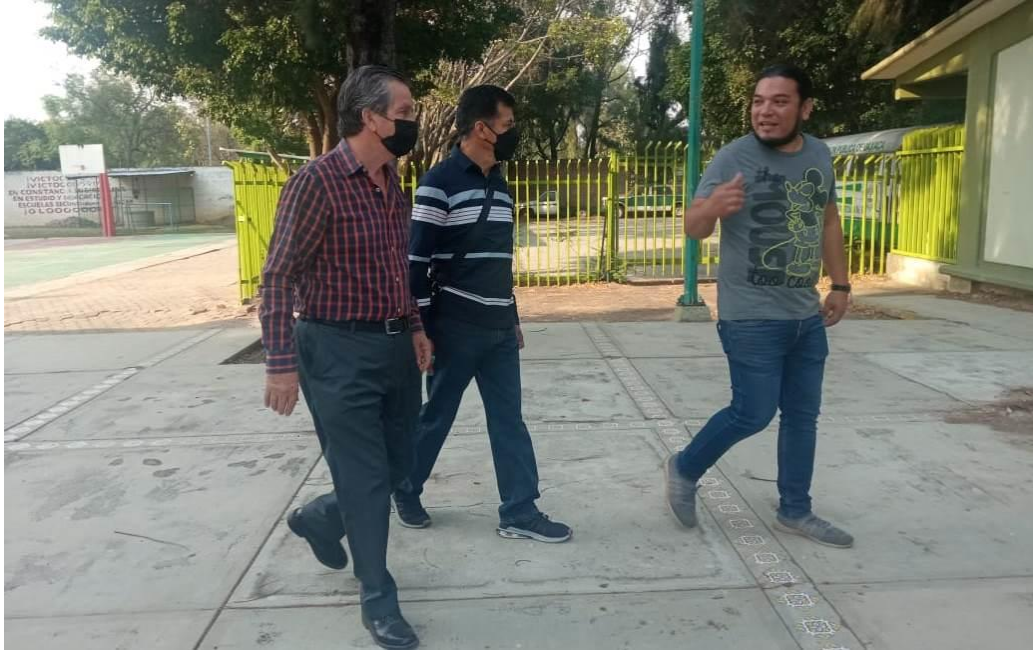
Recorrido por las Instalaciones de la Escuela Secundaria Técnica número 6, junto al Comité de Padres de Familia.