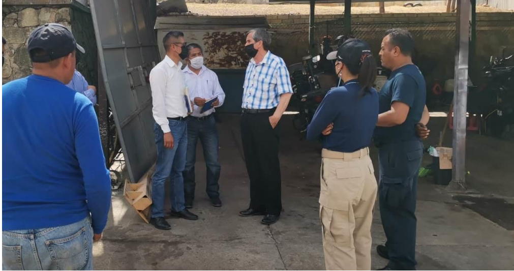
Recorriendo Instalaciones del Taller de Mantenimiento de la Secretaría de Seguridad Ciudadana, Movilidad y Protección Civil.

He realizado 74 recorridos, visitas y a la vez reuniones a diferentes áreas de las Dependencias Municipales, Proyectos de Secretarías, visitas a Colonias y Atención a diferentes Sectores de nuestro Municipio.