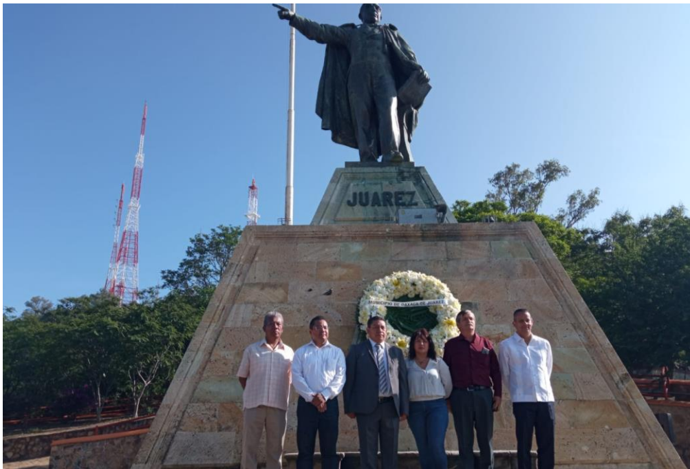
Depósito de Ofrenda Floral en el Monumento a Benito Juárez García, con motivo de su 150 Aniversario Luctuoso.