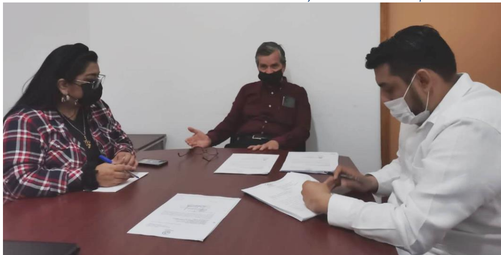
En sesión ordinaria de la Comisión de Normatividad y Nomenclatura Municipal.