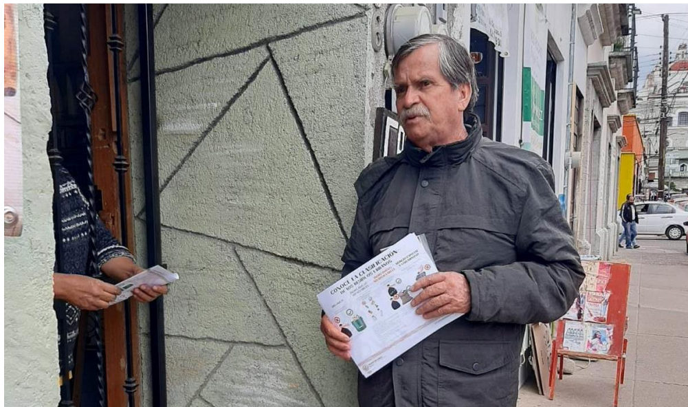
Concientizando a la Ciudadanía sobre la separación de los residuos sólidos urbanos, en diversas calles del Centro Histórico del Municipio de Oaxaca de Juárez