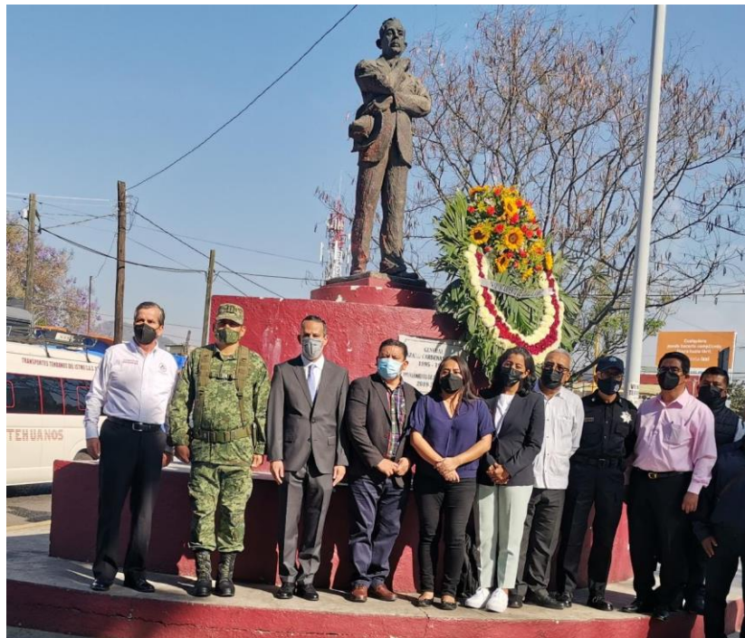
Depósito de Ofrenda Floral en el Monumento al Gral. Lázaro Cárdenas del Río.