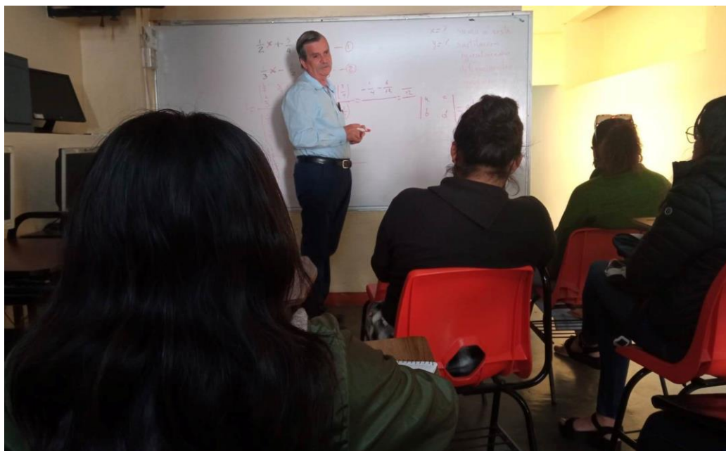
Impartiendo clases de Algebra en la Preparatoria Abierta "José Vasconcelos" el día 11 de junio.