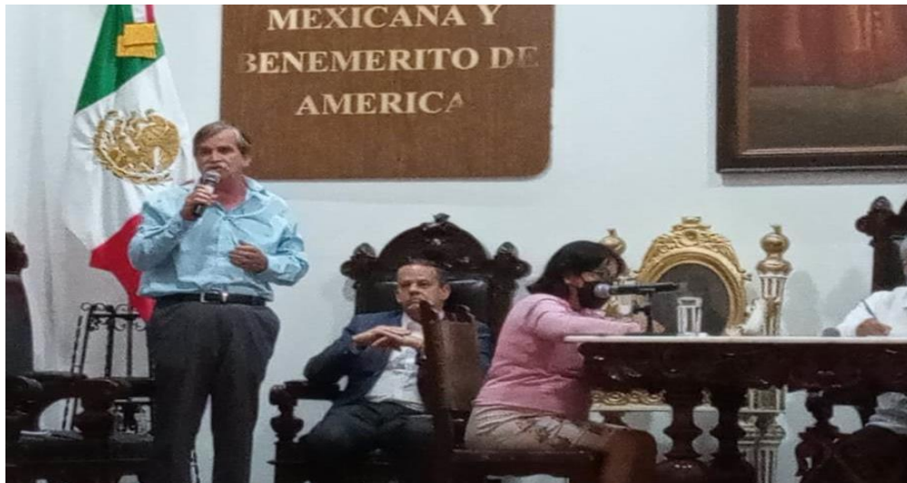
En sesión extraordinaria de Cabildo de fecha 28 de marzo, en donde se aprobó el dictamen emitido por Comisiones Unidas de Normatividad y Nomenclatura Municipal y de Igualdad de Género, por el cual se crea el Reglamento Interno del Consejo Municipal para la prevención, Atención, Sanción y Erradicación de la Violencia de Género contra las mujeres del Municipio de Oaxaca de Juárez.