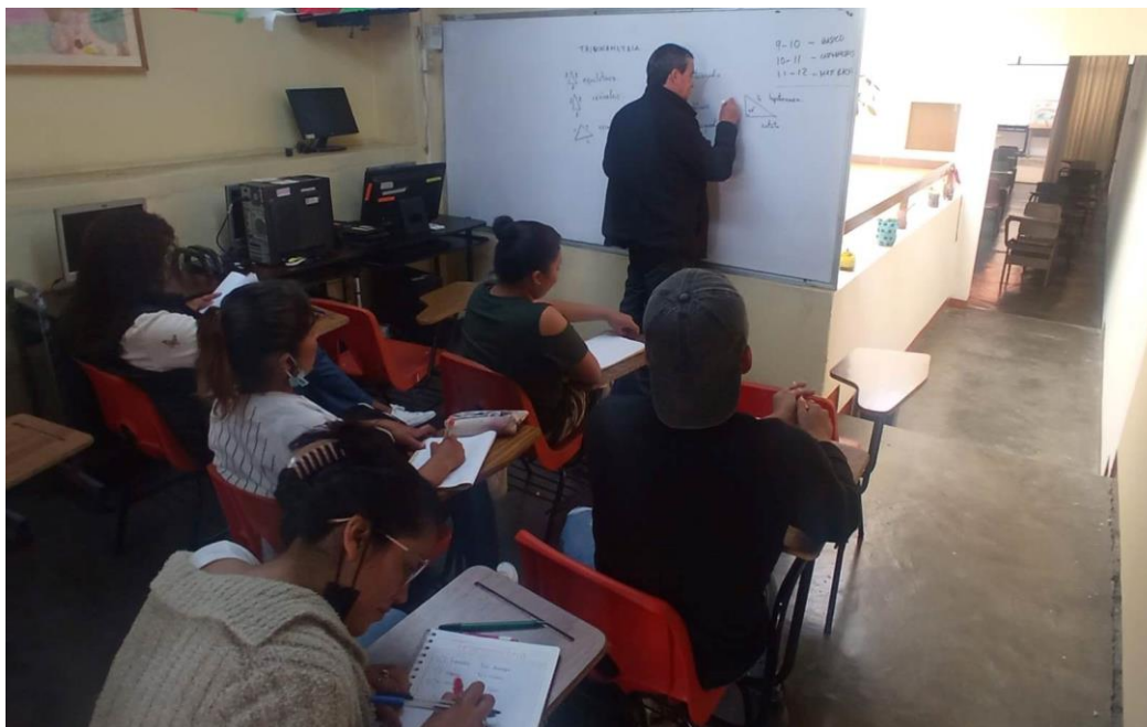
Impartiendo clases de Trigonometría en la Preparatoria Abierta "José Vasconcelos" el día 17 de Septiembre