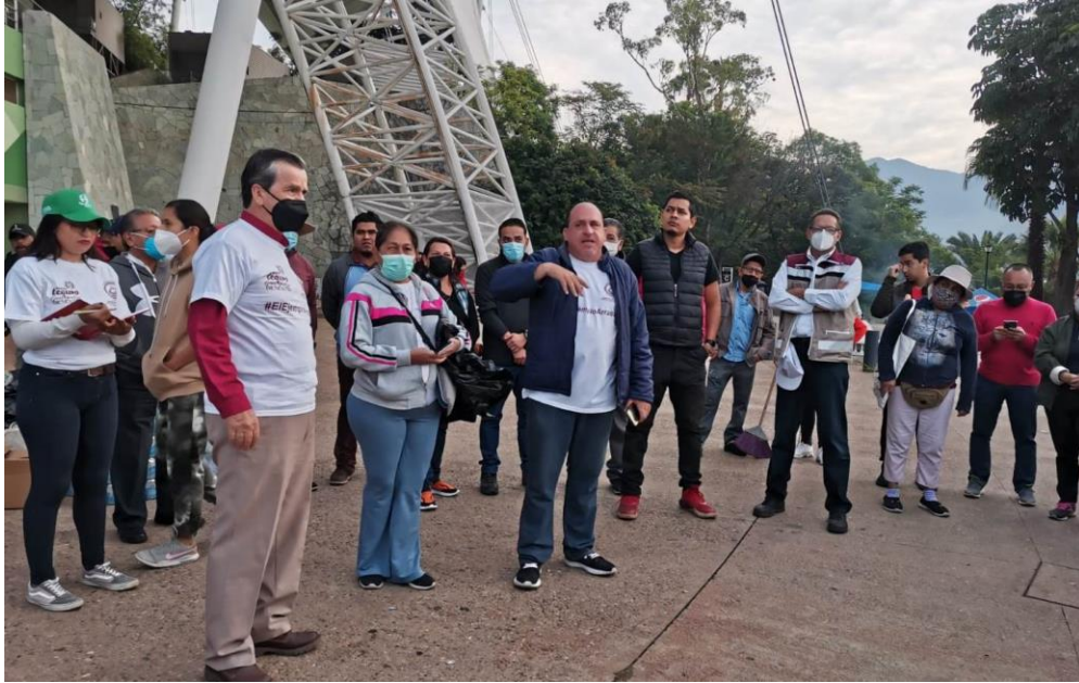
Sumándonos al Macro tequio Guelaguetza Bienestar.