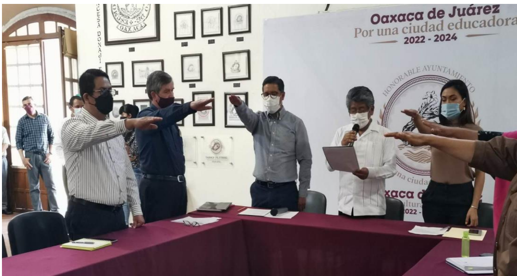
Rindiendo protesta como integrante del Comité de Adquisiciones de Bienes, Arrendamientos, Enajenaciones y Contratación de Servicios del Municipio de Oaxaca de Juárez.

Tengo la oportunidad de formar parte del Comité de Adquisiciones de Bienes, Arrendamientos, Enajenaciones y Contratación de Servicios del Municipio de Oaxaca de Juárez, a las cuales he asistido a 16 Sesiones de Comité, donde hemos debatido, estudiado y votado diversas contrataciones o prestaciones de servicios para el buen funcionamiento y siempre en beneficio de nuestro municipio.