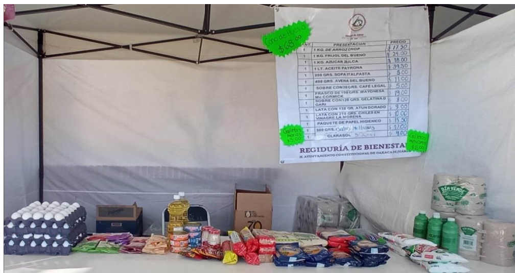
Productos que se ofertan en la venta de la canasta básica a bajo costo.