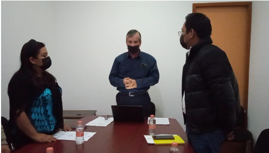
En la Instalación de la Comisión de Bienestar.

Como Presidente de la Comisión de Bienestar he convocado a 4 Sesiones Ordinarias, donde sus integrantes hemos llevado propuestas y actividades a realizar en beneficio de las y los ciudadanos de Oaxaca de Juárez.