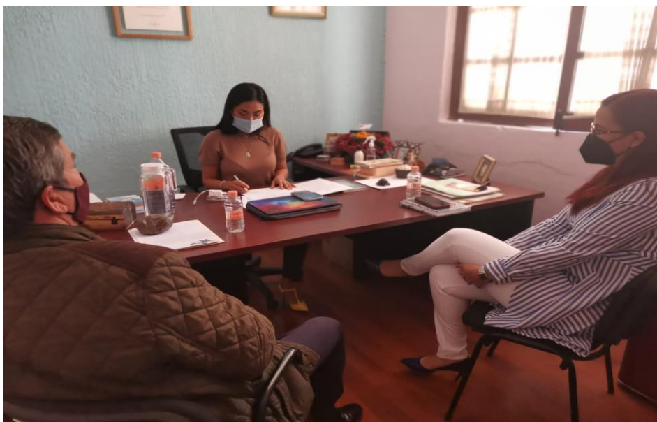
En la Instalación de la Comisión de Atención a Grupos en Situación de Vulnerabilidad.