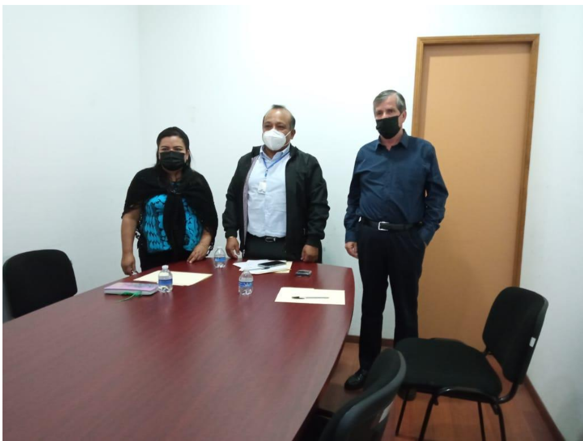
En la instalación de la Comisión de Zona Metropolitana

En la Comisión de Zona Metropolitana, aprobamos convenios y acuerdos de colaboración para establecer una coordinación eficiente con los municipios colindantes y aledaños al nuestro, así como el estudio de diversos problemas que como municipios vecinos compartimos, a los cuales les dimos propuestas para su inmediata atención.