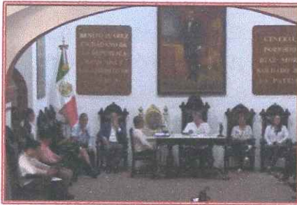
del H. Ayuntamiento.

❖ CU/CNNM/CCHM/CIG/CSCyM/009/2023 , Mediante el cual se aprueba adicionar la fracción V al artículo 156 del Bando de Policía y Gobierno del Municipio de Oaxaca de Juárez. Así lo resolvieron por mayoría las comisiones de Normatividad y Nomenclatura Municipal, Hacienda Municipal, Igualdad de Género y de Seguridad ciudadana y Movilidad